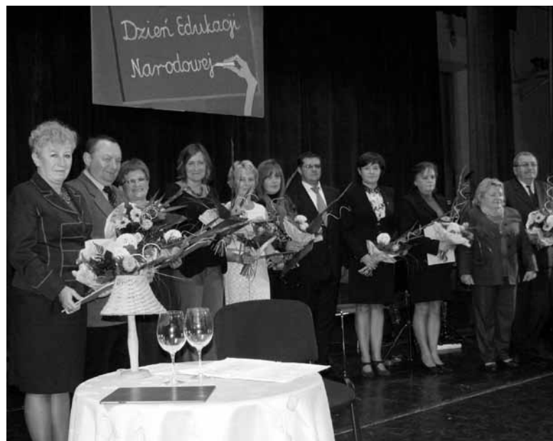
Nauczyciele nagrodzeni z okazji Dnia Edukacji Narodowej