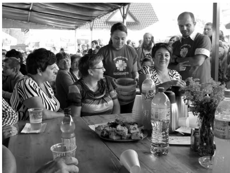
Bawiąc się na festynie, pomagaliśmy bliźnim.