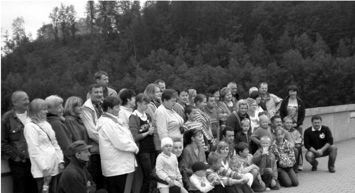
Na wycieczce w Beskid Śląski.

W dniach 11-12 sierpnia Stowarzyszenie Rozwoju Wsi Krzyżowa Dolina zorganizowało wycieczkę turystyczno-krajoznawczą dla dzieci oraz ich rodziców do Ustronia, Wisły i Inwałdu, wspartą w ramach realizacji zadania publicznego przez Gminę Ozimek.