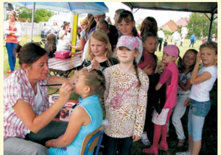
Festyn z okazji Dnia Dziecka.