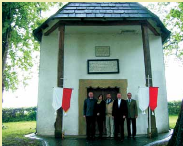
Nasza delegacja przed kaplicą św. Liboriusa w Bredenborn.