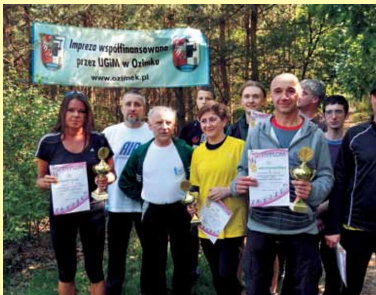
Zwycięzcy w kategorii „open”.