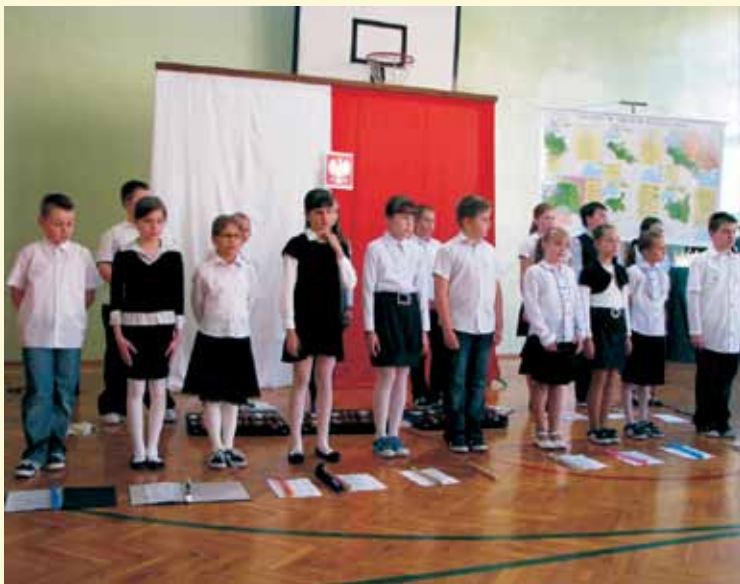
Święto Konstytucji 3 Maja.