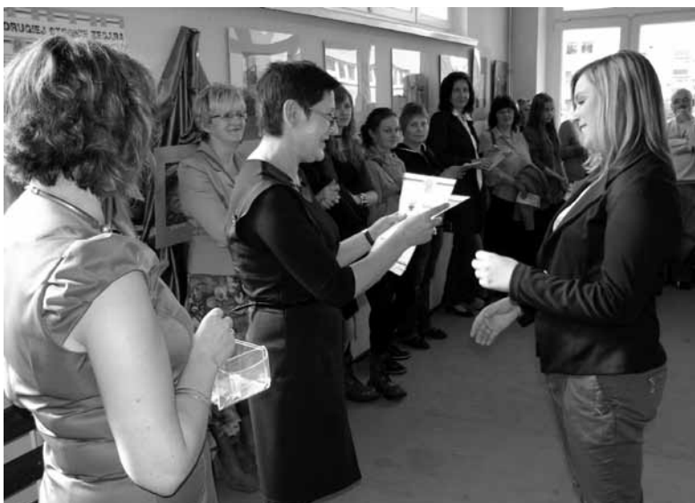
Absolwenci otrzymali dyplomy za udział w zajęciach kulturalno-artystycznych.