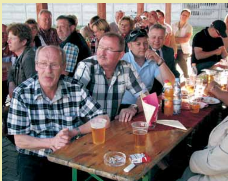
Mieszkańcy Bredenborn i Krzyżowej Doliny na wspólnej biesiadzie.