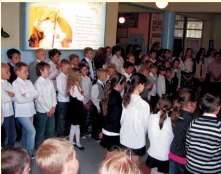
Święto szkoły im. Jana Pawła II w Szczedrzyku.