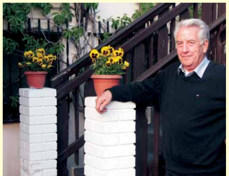
2012 r. - Podczas ostatniej wizyty w Polsce.