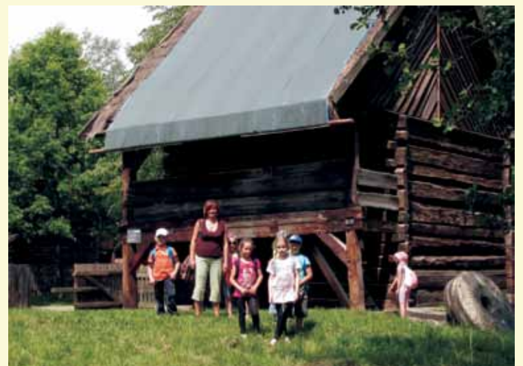
Wycieczka do skansenu w Bierkowicach.