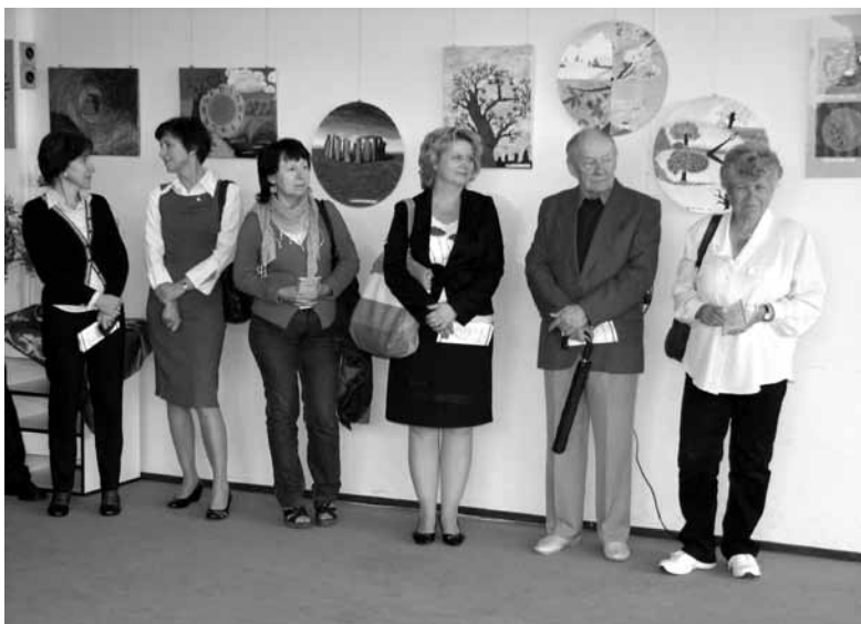
W Galerii „Motyw” odbył się wernisaż wystawy „Po drugiej stronie zegara”.