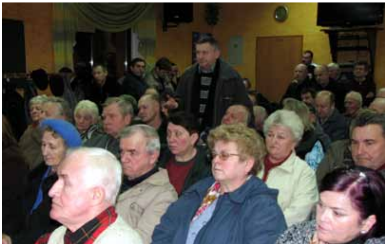
Zebranie wiejskie w Szczedrzyku.