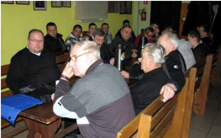
Zebranie sprawozdawczo-wyborcze OSP Dylaki.