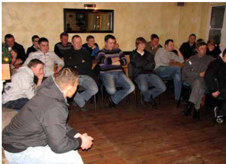
Zebrań sprawozdawczo-wyborcze OSP Krzyżowa Dolina.

Pięcioletnią kadencję działalności kończą zarządy Ochotniczych Straży Pożarnych działających w gminie Ozimek. W styczniu rozpoczął się cykl zebrań sprawozdawczo-wyborczych, które odbędą się we wszystkich jednostkach OSP. Jako jedna z pierwszych, swoją działalność podsumowała OSP Krzyżowa Dolina.