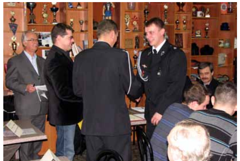
Zebranie sprawozdawczo-wyborcze OSP Krasiejów.