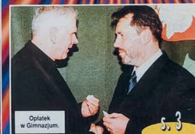
Oplatek w Gimnazjum.