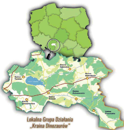
Lokalna Grupa Działania „Kraina Dinozaurów”

Publikacja opracowana przez Lokalną Grupę Działania „Kraina Dinozaurów”, współfinansowana ze środków Unii Europejskiej w ramach Schematu II Pomocy Technicznej „Krajowa Sieć Obszarów Wiejskich” Programu Rozwoju Obszarów Wiejskich na lata 2014-2020 Instytucja Zarządzająca Programem Rozwoju Obszarów Wiejskich na lata 2014-2020 – Minister Rolnictwa i Rozwoju Wsi.