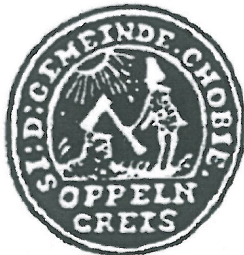
Pieczęć z 1755