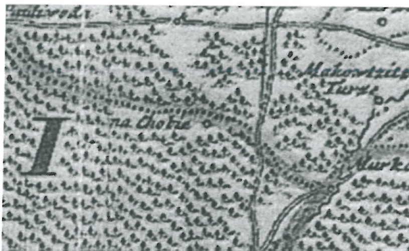
Mapa Księstwa Opolskiego z 1736

Pierwsze wzmianki na temat naszej wsi znaleźć możemy już w 1736 roku na mapie Księstwa Opolskiego. Istnieją dwie teorie nadania wiosce nazwy. Pierwsza zakłada że nazwa pochodzi od gwarowego określenia chwasty, gałęzie, korzenie, które to najprawdopodobniej otaczały zadłużony książęcy folwark. Druga teoria, według autorów niemieckich, wywodzi nazwę od jastrzębia, zwanego potocznie „Kobuch” względnie wrony – „Kuba”. 10 czerwca 1754 roku dokonano podziału ziem pomiędzy 12 okolicznych osadników, którzy zobowiązali się wybudować w tym miejscu swoje zagrody.