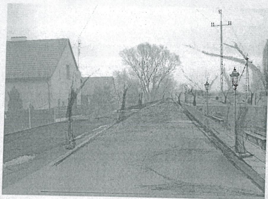
Ulica Klasztorna- projekt 3