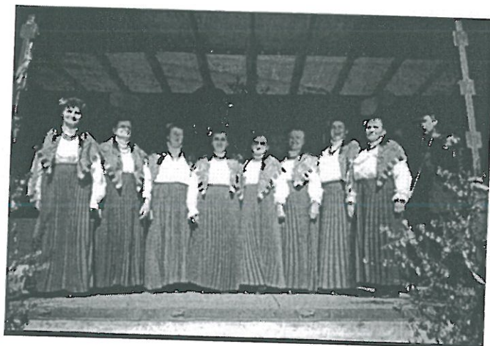
Zespół „Grodziec” podczas występu z okazji „Dni Grodzca”

„Jutrzenka” przed występem z okazji „Dni Grodzca”