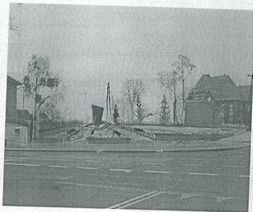
Róg ulic Częstochowskiej i tartacznej - projekt 1

Rys. 3: Centrum wsi – pomnik pamięci ofiar poległych w wojnach światowych i walkach w obronie ojczyzny.