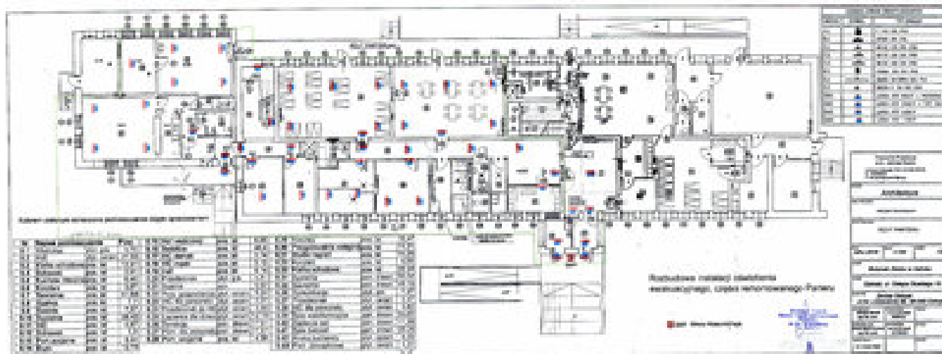
A1 Rozbudowa instalacji oświetlenia ewakuacyjnego